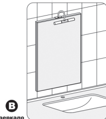
зеркало в вертикальной ориентации